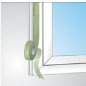
Stuik aansluiting bij kozijnmontage